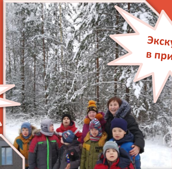
Экскурсии в природу