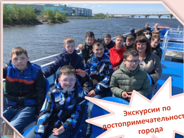
Экскурсии по достопримечательностям города